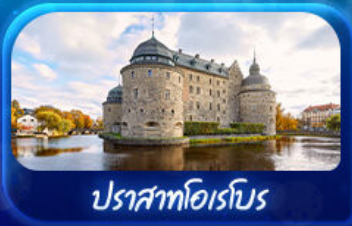
ปราสาทไอเรโบ