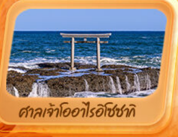
ศาลเจ้าโองาโระอิซซากิ

แพคเกจพิเศษ "ฟูจิซัง" ที่หมู่บ้านโอชิโนะ อักโท สวนโออิชิปาร์ค ที่เที่ยว Unseen นั่งกระเช้าชมวิวภูเขาฟูจิ ทะเลเจ้าโองาโระอิซซากิ เสาโทริอิริมทะเล อลังการโบสถ์เปลี่ยนสี น้ำตกเคงอน ศาลเจ้านิกโกโทโชกุ เสิร์มมงคล วัดพระใหญ่อุซึคุ ไดบุคสี ห้ามพลาดโคมแดงยักษ์ วัดอาซากุสะ อิมอร้อยตลาดปลาโทโยสุ ภัตตาคารแนว 3D ย่านชิจูกุ ซุปป์ิงจู่ย่านดังชิบูย่า