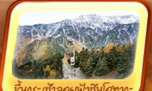
ขึ้นกระเช้าลอยฟ้าชินโงทากะ