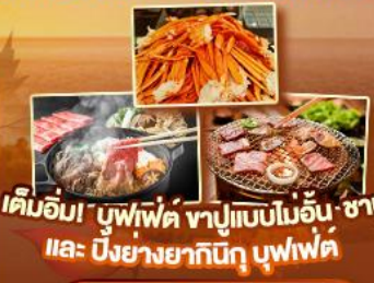
เค็มอิม่า บุฟเฟ่ต์ ซาปูแบบโมอิน ซาปู และ บิงย่างยากินุกุ บุฟเฟ่ต์

สัมผัสความเป็นญี่ปุ่น ชมวิวฟูจิ ครบทุกไฮไลท์เด่นๆ ห้ามพลาด ขึ้นดาตั้นใจกับหมู่บ้านมรดกโลกหมู่บ้านชิราคาวาโกะ ขึ้นกระเช้าลอยฟ้าชินโงทากะ ป้อนนมเขมเบ็น้องทวาง นารา ขอพรวัดโทไดจิ เช็กอินปราสาทโอซาก้า วัดคิโยมิต्सึดะ ถ่ายรูปทำซูมิมือสุดฮิต ป้ายกุสิโกะ ปราสาทมัตสึโมโด้ ทะเลสาบชูวะ ขึ้นชมศาลเจ้าฟูจิซังเซมเนง หมู่บ้านน้ำใสโฮชิโนะฮักโก ปิดท้ายช้อปปิ้งย่านดัง ชินจูกุ