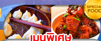
เมนูพิเศษ เสี่ยวหลงเปา หมูน้ำแดง เดินทาง ต.ค. 69 - มี.ค. 70