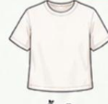
เสื้อยืด