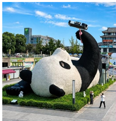
วัดต้าสือ (Daci Temple)

เดินทางสู่อีก 1 จุดเช็คอิน ที่ไม่ควรพลาดของเมืองตูเจียงเยียน จัตุรัสหย่างเทียนวู (Yangtianwo Square) เป็นจุดถ่ายรูปยอดนิยมซึ่งท่านจะได้ชมประติมากรรมรูปปั้น หมีแพนด้าเซลฟี่ (Selfie Panda) หมีแพนด้าตัวใหญ่ที่กำลังนอนหงายเซลฟี่ ณ ใจกลางจัตุรัสหย่างเทียนวู เป็นภาพแสนน่ารักซึ่งอันจะทำให้เราหลงไหลและไม่พลาดที่จะถ่ายรูปคู่เป็นที่ระลึกกันเลยทีเดียว จากนั้นนำท่านเดินทาง เทียวชม วัดต้าสือ (Daci Temple) คือวัดพุทธนิกายมหายานที่มีชื่อเสียงโด่งดังและเก่าแก่ที่สุดแห่งหนึ่งในภูมิภาคตะวันตกเฉียงใต้ของจีน มีประวัติศาสตร์อันยาวนานกว่า 1,600 ปี วัดต้าสือ มีสถาปัตยกรรมจีนแบบดั้งเดิมที่สวยงาม โดยมีอาคารและโครงสร้างที่สร้างขึ้นจากไม้และอิฐ มีหลังคาสูงและตกแต่งด้วยลวดลายที่ละเอียดบริเวณรอบๆ วัดมีสวนและพื้นที่สีเขียวที่สวยงาม นักท่องเที่ยวสามารถเดินเล่นและสัมผัสกับความงามของธรรมชาติได้