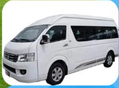
ภูเก็ตซิตีทัวร์