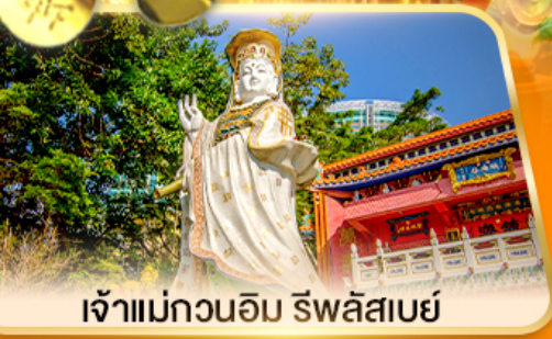
เจ้าแม่กวนอิม ธิพลสเบย์