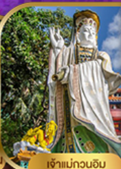
เจ้าแม่กวนอิม รพัสสมย์