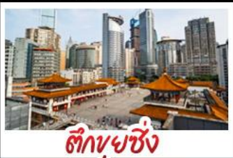
ตึกยูนชิ่ง

พระแกะสลักหินต้าจู้ - หลุมฟ้าสะพานสวรรค์ - เขานางฟ้า ตึกยูนชิ่ง - ตึกตะเกียบ หมู่บ้านโบราณฉือซีไห่