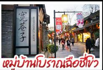
หมู่บ้านโบราณฉือซีไห่