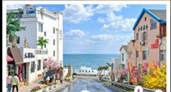
ถนนคอปเปลิ่งสาขาที่เปิด