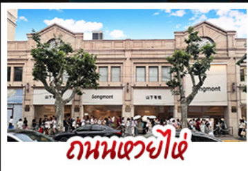
ถนนเซวี่ไผ่