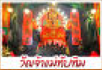
วัดเจ้าพ่อทรงเต็งเต่งเต่า