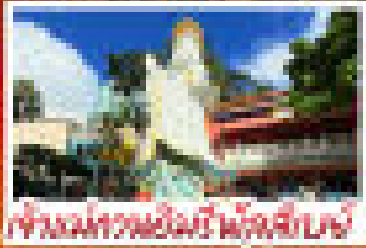
เจ้าพ่อทรงเต็งเต่งเต่า