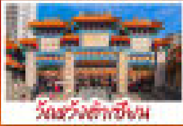
วัดเจ้าพ่อทรงเต็งเต่งเต่า

วัดเจ้าพ่อทรงเต็งเต่งเต่า - พระเจ้าบรอนซ์ พระใหญ่ไถ่รอด - เจ้าพ่อทรงเต็งเต่งเต่า วัดสะถี่เกี๋ยง - วัดวัดเจ้าพ่อทรงเต็งเต่งเต่า