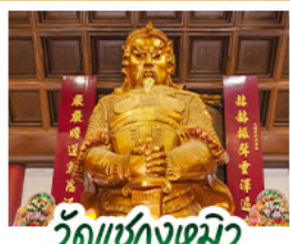
วัดเซ่งหิว