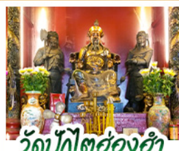
วัดบิกิตฮ้องฮ่า