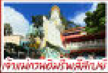
เจ้ามืดมิ่งเจ้าฟ้าเจ้าแผ่นดิน