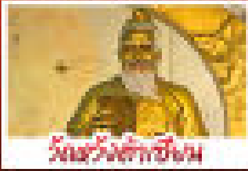
วัดหวังผ่องสุข

เที่ยวทั่ว วัดเจ้าแม่กวนอิมแดงเต้า | วัดเจ้าแม่กวนอิม พระใหญ่ไถ่เอ็ง | เจ้ามืดมิ่งเจ้าฟ้าเจ้าแผ่นดิน วัดกลางพระ | วัดหวังผ่องสุข | วัดเจ้าแม่กวนอิม