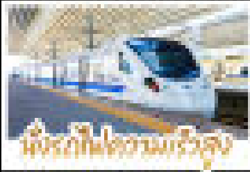
สัมผัสวิถีชุมชนเมืองใหม่

บัตรโดยสารรวมวีซ่า ท่องเที่ยว 10 ประเทศ สถานีไปเมืองใหม่ ณ ท่าอากาศยาน สถานีท่ารถและสถานีรถไฟ