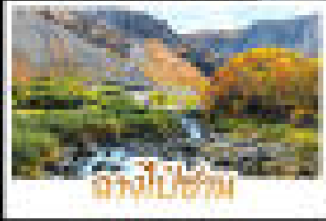
สัมผัสเมืองใหม่