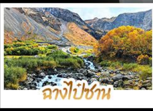
ฉางไป่ชาน