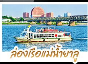
ล่องเรือแม่น้ำฮาลู