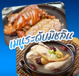
เมนูระดับมิชลิน

เดินทาง | 02 - 07 ก.ย. 69 20 - 25 ส.ค. 69 | 17 - 22 ก.ย. 69