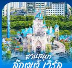
สวนสนุก คยองฮี วัลรี่