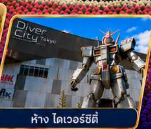
ห้าง ไดเวอร์ซิตี