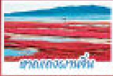
หาดทองแหวน