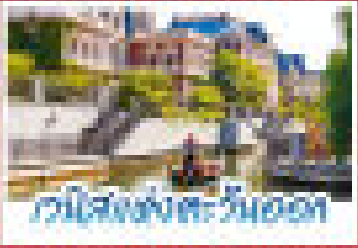
วัดใต้สงขลา