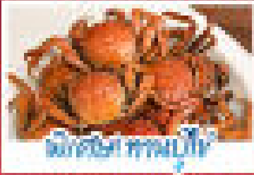
จับปลา ทานปู

โปรแกรม 10 วัน 10 คืน... (รายละเอียดโปรแกรม)