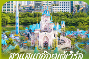
สวนสนุกล็อตเทอเวเอร์ลด์ Lotte Adventure World