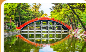
ศาลเจ้าซูมิโยชิ โกเบ