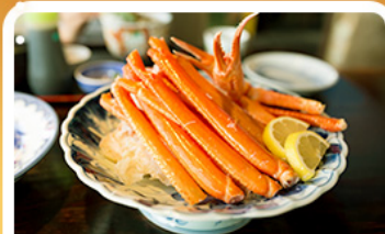
พิเศษ! ขาปู