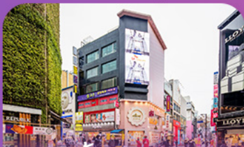
ช้อปบิงข่านเมียงดง