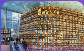
ตึງสูงมุดดสตาร์ฟิลา

เก็บทุกไฮไลท์ ในกรุงโซล ตั้งแต่ความงดงามของ พระราชวังเคียงบ็อก ชมวิวสุดอลังการที่ ดึงลือตเต็ โซลสกาย (รวมค่าลิฟต์ขึ้นตึก) สนุกสุดมันส์ที่ สวนสนุกลือตเต็ เวิร์ล (รวมค่าบัตรเครื่องเล่น) พลิตเพลนไปกับโลกใต้ทะเล ลือตเต็ อควาเรียม (รวมค่าบัตรเข้าชม) เช็กอินแลนด์มาร์กสุดฮิตอย่างห้องสมุดสตาร์ฟิลา โคเอกมอลล์ เดินเล่นย่านฮิป บริกสินทาหลี ซองชุง และช้อปปิ้งซัมเมอร์สูล สุดฟิน ย่านเมียงดงและฮงแด