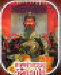
ชมเทพเจ้า อึ้งจิ้งฉาง