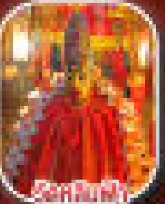
ชมเทพเจ้า