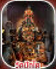
ชมป้าต๋อง