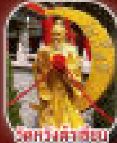
ชมหลวงพ่อซ่ง

เข้าชมพิพิธภัณฑ์ - ฮ่องกงดิสนีย์แลนด์ - ภูเขาเทียนมุ พิพิธภัณฑ์ - สวนพฤกษศาสตร์ - สวนพฤกษศาสตร์ สวนพฤกษศาสตร์ - สวนพฤกษศาสตร์ - สวนพฤกษศาสตร์ พิพิธภัณฑ์ - สวนพฤกษศาสตร์ - สวนพฤกษศาสตร์ พิพิธภัณฑ์ - สวนพฤกษศาสตร์ - สวนพฤกษศาสตร์ พิพิธภัณฑ์ - สวนพฤกษศาสตร์ - สวนพฤกษศาสตร์