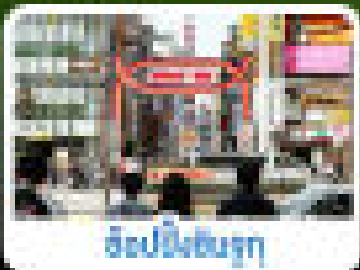
ฮอนเม็งชินจู