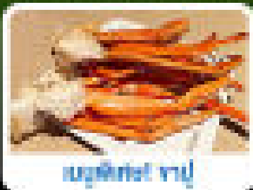
เมนูพิเศษ ฟูจิ