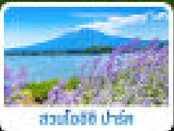
สวนดอกไม้ ฟูจิ