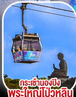
กระเช้าองปิง พระใหญ่ไผ่หวิน