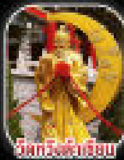
วัดโพธิ์เก้าต้น

ขอใบรับประกันการเดินทางเป็น 300 บริการรถแท็กซี่ฟรีตลอด - ๑๑๒ Service 24 ชั่วโมง - บริการรถแท็กซี่ Service 24 ชั่วโมง - Service