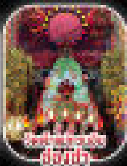
วัดบึงกุ่ม วัดบึงกุ่ม