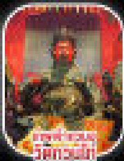
วัดบึงกุ่ม วัดบึงกุ่ม