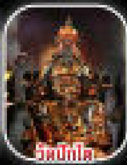
วัดบึงกุ่ม