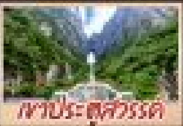
เกาะปู้-ตงสวีร์ตี้