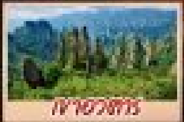
เกาะหวงตง