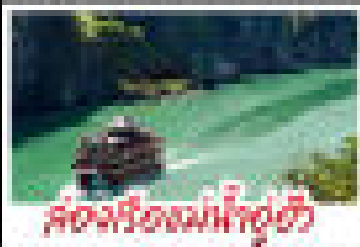
ส่องเมืองมรดกโลก

อินทรี - อัครา - สวรรค์ทอง กลุ่มฟ้าสามและพามสวรรค์ - พงศาตย์ พุทธศิลป์ล้ำค่า - ส่องเมืองมรดกโลก