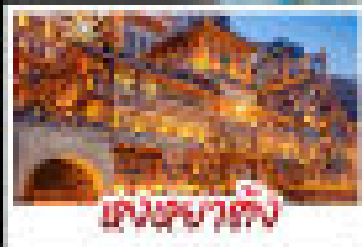
เมืองขอมลือเลื่อง