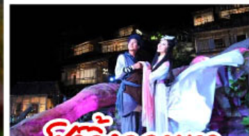
ซิ่วจิ้งจอกขาว