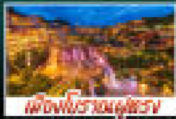
เมืองโบราณภูเก็ต