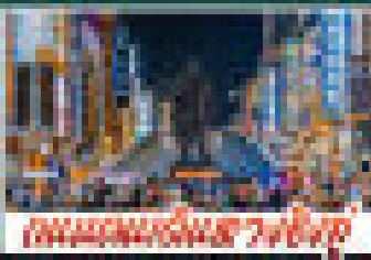
ถนนหนทางภูเก็ต