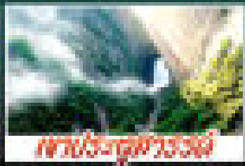
เกาะลันตา