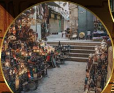
ตลาดข่านเอลคาลลี