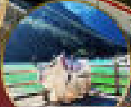
อุทยานแห่งชาติลี่เจียง