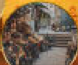
ชมทิวทัศน์แม่น้ำไนล์