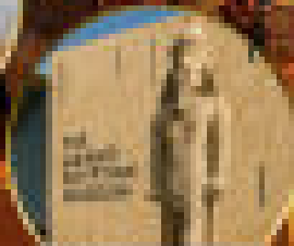
ขี่อูฐในทะเลทราย