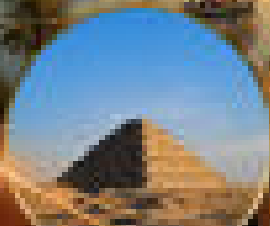
ปิรามิดในกิซา