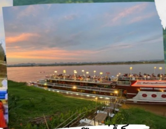
ล่องเรือแม่น้ำโขง