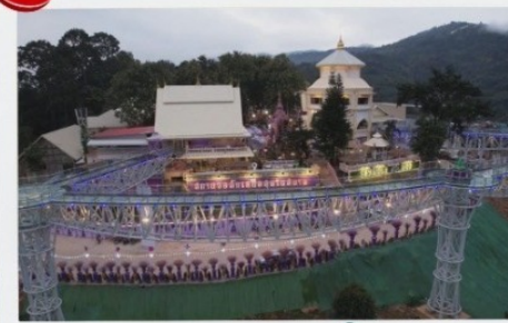
สกายวอล์ค

2 ท่านขึ้นไป 14,499 บาท/ท่าน 4 ท่านขึ้นไป 12,799 บาท/ท่าน 6 ท่านขึ้นไป