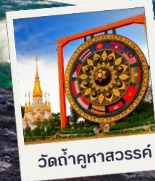
วัดถ้ำคูหาสวรรค์