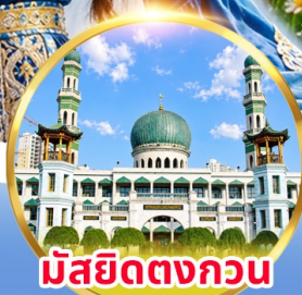
มัสยิดตงกอน