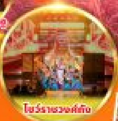
โอรสราชวงศ์ถัง