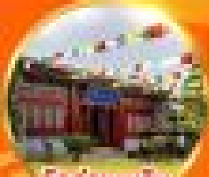
วัดกั๋วเซ่