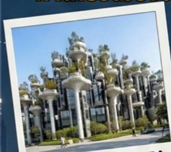
อาคาร 1000 ต้นไม้