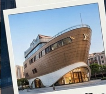
เข็คอินเรือหลุยส์วิทอง