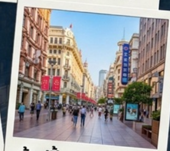
ช็อบปิงถนนนานจิง