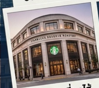
สตาร์บัคเซี่ยงไฮ้