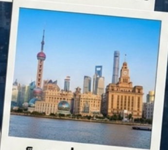
เข็คอินที่เดอะบันด์