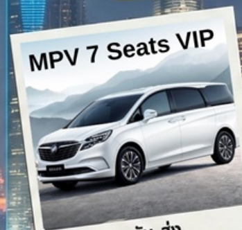
MPV 7 Seats VIP