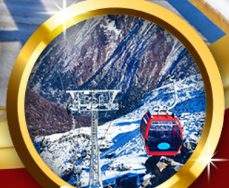
ต้ากู่ปิงชเวน

“เยือน 3 อุทยานระดับโลก” พินฮิมะต้ากู่ สี่ดรุณี ปี้เฉิงโกว ต้ากู่กลาเซียร์ (รวมรถอุทยาน+กระเช้าขึ้น-ลง) แชะภาพแพนด้าเซลฟี ตะลุยซุนซีลู่