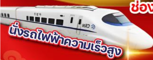
ขั้รถไฟฟ้าความเร็วสูง