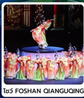
โชว์ FOSHAN QIANGQING