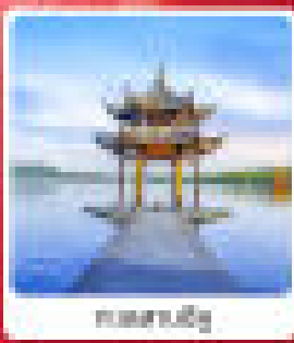
สวนสาธารณะ

ไฮไลท์... เซี่ยงไฮ้ หางโจว สองเมืองอันมหัศจรรย์ ชมความสวยงามของสถาปัตยกรรม วัฒนธรรม