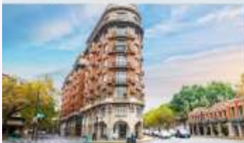
ถนนอู๋คัง