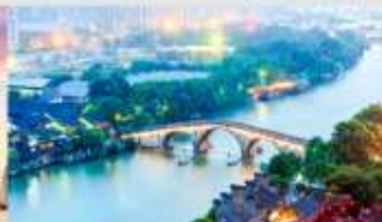
คลองโบราณจิงหาง