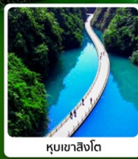
คุนเขาสิงโต