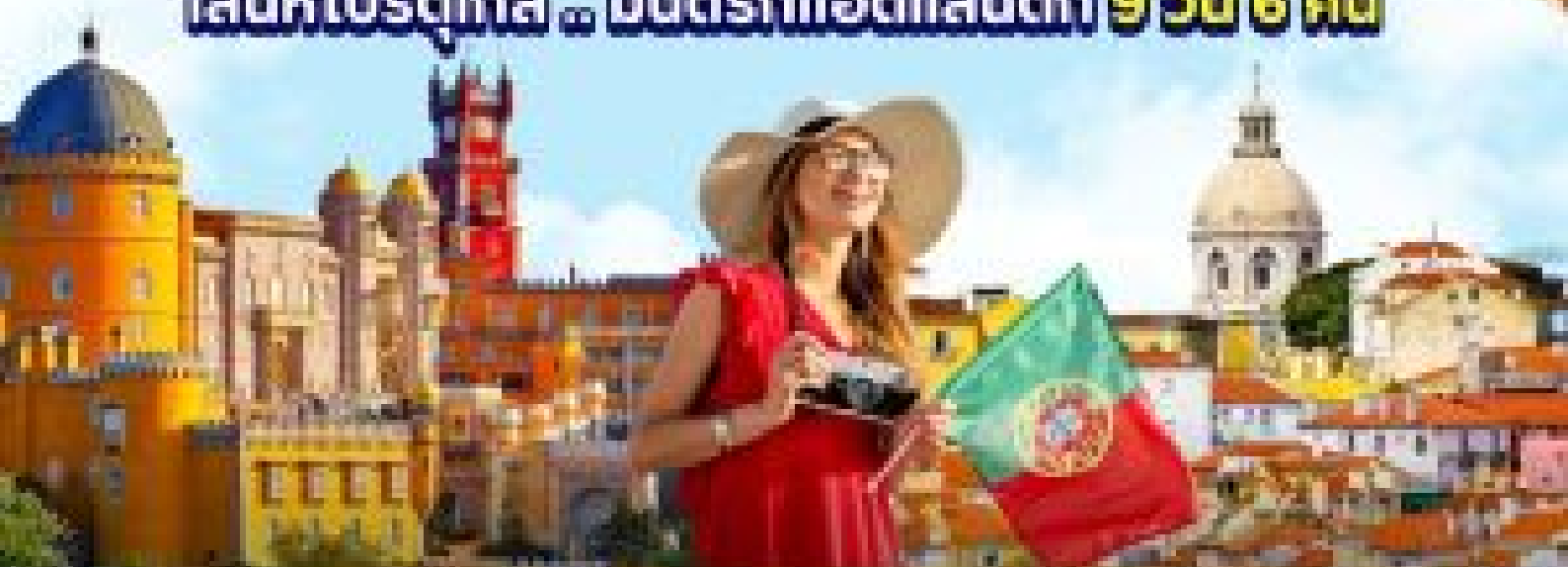
เที่ยวกรุงลิสบอน