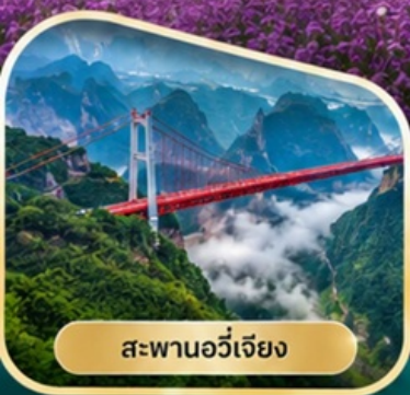
สะพานอวีเจียง