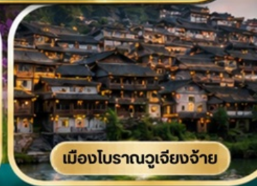
เมืองโบราณวูเจียงจ้าย