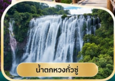
น้ำตกหวงกั๋วชู่