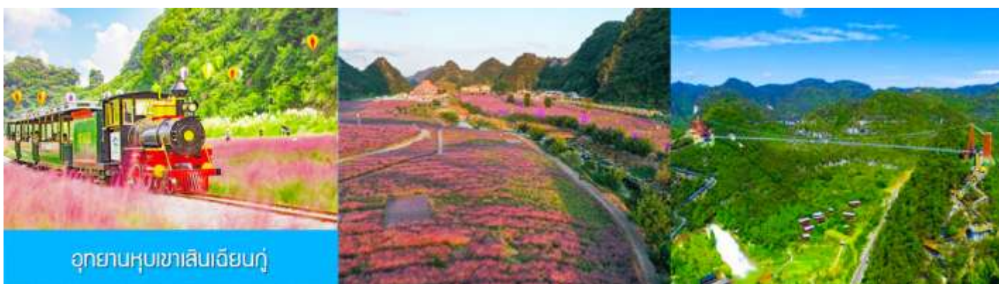
อุทยานหุบเขาเสียนเจียนกุ๋