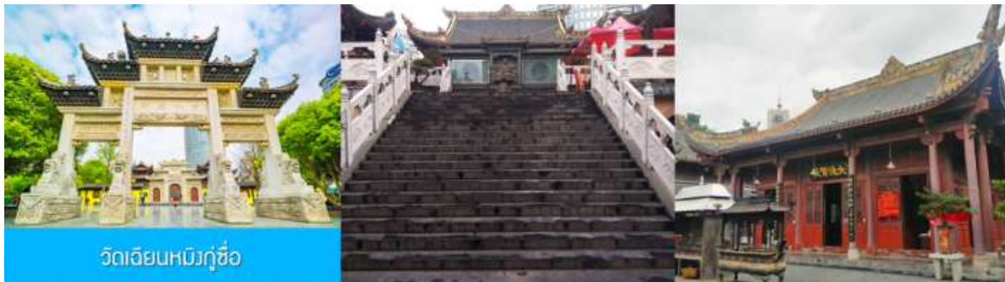
วัดเจียนหมิงกุ๋ซื่อ