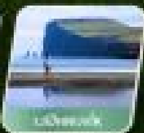
เมืองหลวง