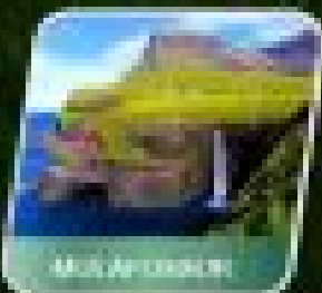
เมืองหลวง

เที่ยวชม-กิจกรรมทางบกทะเลฟรี ฟรี SEA VIEW 4 คืน ชมหมู่บ้านชาวประมง & ล่องเรือชม สองช่องแคบ PUFFIN ฟิชเชอร์MANE CLIFF CITY TOUR ในเมืองหลวง 1 วัน