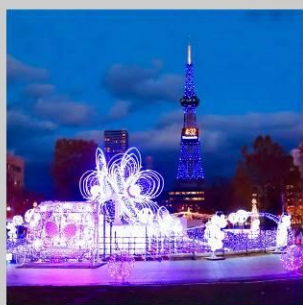
“SAPPORO WHITE ILLUMINATION”