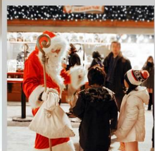
“ODORI GERMAN MARKET”