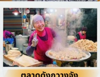
ตลาดดังกวางจ้ง