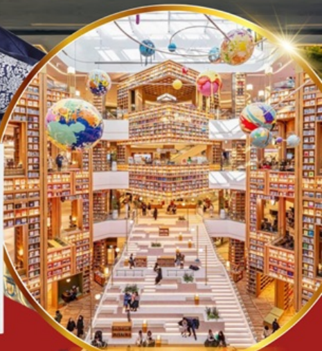
ห้องสมุด สตาร์พลาซ่า ซูวอน

เชคอินห้องสมุดสุดอลังการ ชมศิลปะดิจิทัลสุดล้ำ บนจอ LED เสมือนจริงขนาดยักษ์ หมู่บ้านเกาหลีโบราณบุกซอน อื่นอก อิสระซ็อบปัง 2 ย่านดัง ซองซู เมียงดง ช้อปปิ้งปลอดภาษี Lotte Duty Free