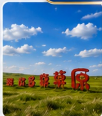
ทุ่งหญ้าออร์ดอส พิธีต้อนรับแบบชาวมองโกเลีย สวนชดมองโกเลีย ปาตี้รอบกองไฟ