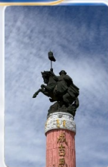
สวนสุสานเจงกิสข่าน (ชมด้านนอก)